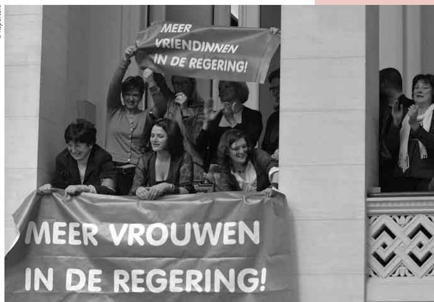
Manif au parlement : il manque des femmes au gouvernement !