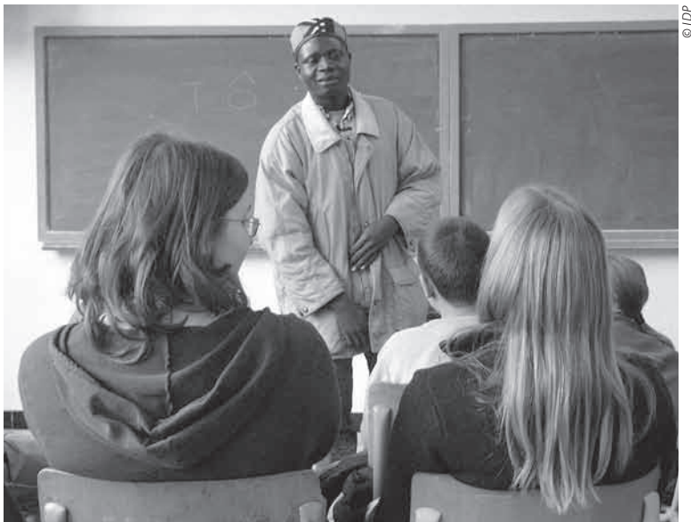
Séance exceptionnelle avec un intervenant burkinabè.

La démarche de suivi-évaluation est exigeante et elle peut être cruelle, parfois. Elle est aujourd'hui pour les acteurs du développement un gage de crédibilité, tant vis-à-vis de leurs bailleurs de fonds, de leurs donateurs que des partenaires pour lesquels ils se mobilisent. ●