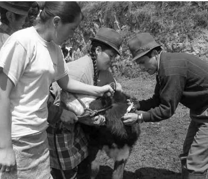
Les techniciens paysans : d'utilité publique.