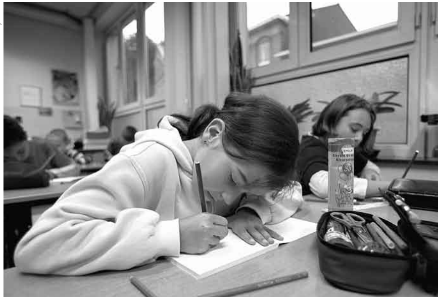
A l'école : le règne des petites filles modèles.

La multiplication des établissements scolaires, l'obligation scolaire pour tous, l'introduction progressive de la mixité dans les classes ont peu à peu concouru à une égalisation des chances entre filles et garçons dans le domaine de l'apprentissage du savoir.