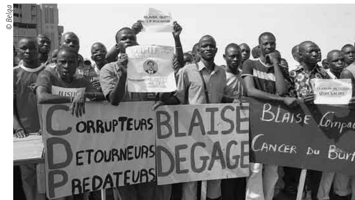
Blaise Compaoré ne semble pas prêt à «dégager» !

Le pouvoir a fait face tant bien que mal, mettant de nombreuses villes sous couvert-feu,