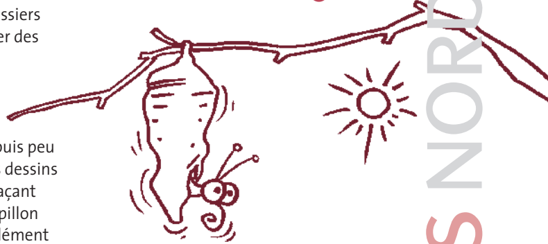
Les mésaventures du papillon renvoient à celles vécues par de trop nombreux humains.

à ce buzz ou encore à ce marketing viral en invitant vos amis et connaissances à visionner ces quatre dessins animés et participer eux aussi à leur diffusion. Pour les retrouver sur Dailymotion, il suffit de cliquer sur le papillon qui se trouve sur la page d'accueil du site Iles de Paix. À vos souris! ●